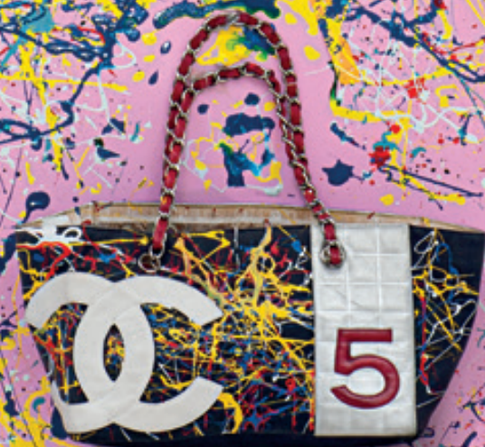
CHANEL No. 5 Tote Bag